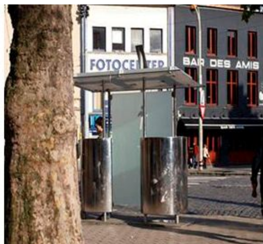
Рисунок 2 – Бесплатная общественная уборная в Праге и в Амстердаме