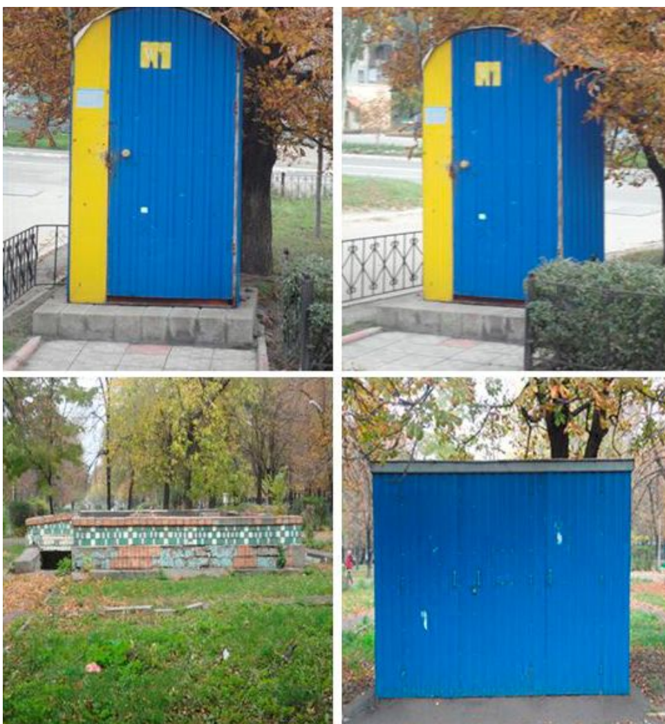
Рисунок 6 – Общественные уборные г. Алчевска