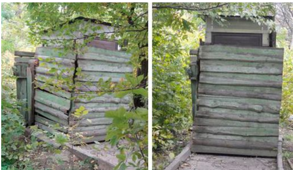
Рисунок 5 – Общественная уборная в городском парке г. Алчевска