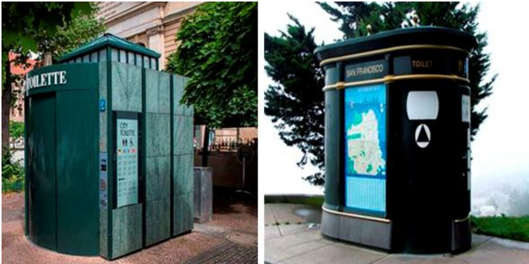
Рисунок 3 – Современные платные общественные уборные в Париже и Берлине

Комплекс, предназначенный для женщин, имеет 4 отдельные кабины и кабину для лиц с ограниченными физическими возможностями (оборудованную пандусом и отдельным входом). Санитарно-гигиенический комплекс представлен на рисунке 4.