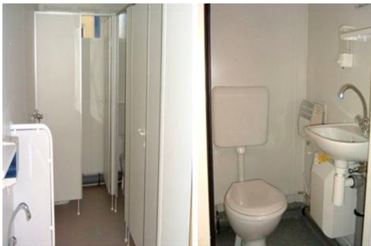
Рисунок 4 – Санитарно-гигиенический комплекс в Донецке