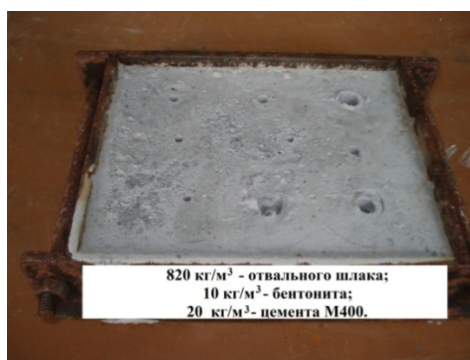
Рисунок 2 – Образец тампонажно-закладочной суспензии, испытанный пенетрометром на 1, 7, 10, 15 сутки

Первые измерения пластической прочности при помощи пенетрометра произвели на 1 сутки, затем на 7 суток от начала затворения. Конус пенетрометра погружали в испытуемый образец по три раза. Это видно на рисунке 2 по оставленным характерным отверстиям. Испытания повторяли на 10, 15 и 20 сутки.